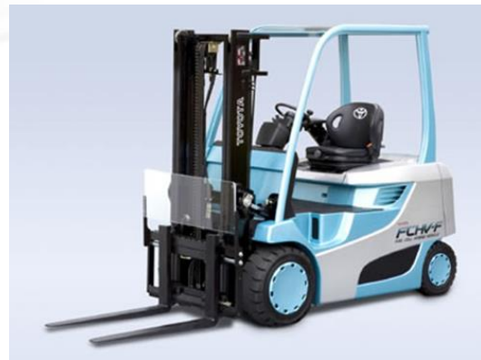
Charriot élévateur à hydrogène