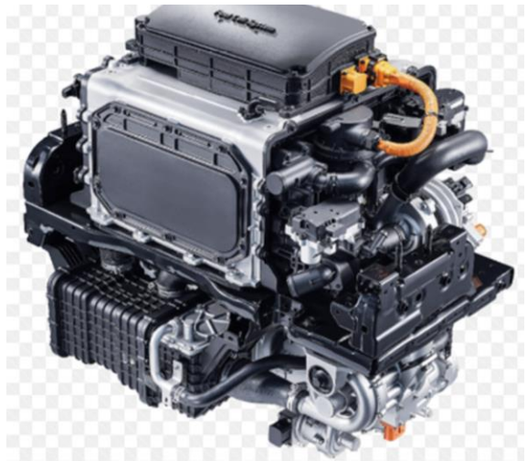
2020 : « Fuel Cell engine »