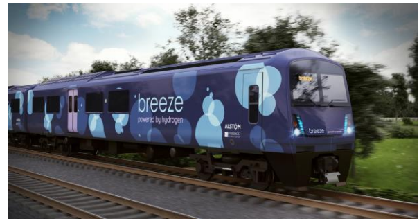
Train à hydrogène