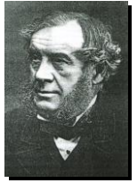
Sir William GROVE 1811 - 1896