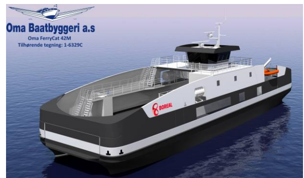
Ferry à hydrogène