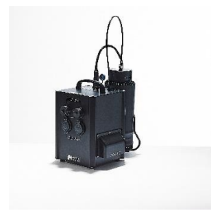
Générateur portable à hydrogène